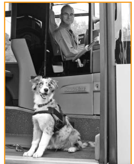
Einstiegsituation am Bus

Übrigens: Wenn Sie ein gültiges Ticket haben, können Sie Ihren Hund (bzw. auch mehrere Hunde) innerhalb des Geltungsbereiches (Preisstufe A2, B, C oder D) kostenlos mitnehmen.