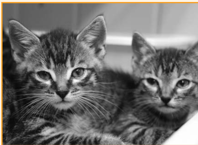
Im Kennel im Container gefunden

Nach diesen Erfahrungen möchte ich Euch bitten genau hinzusehen und hinzuhören: wenn Ihr ungewöhnliche Geräusche aus einem Container hört, schaut bitte einmal rein, es könnte das Leben eines Tieres retten.