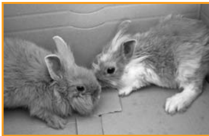
Kaninchen nach der Rettung

Hallo Ihr lieben Tierfreunde, der Tierheimalltag ist hart, darüber kann auch ich, Mona Lisa, Bürohündin aus dem Albert-Schweitzer-Tierheim, ein trauriges Lied singen.