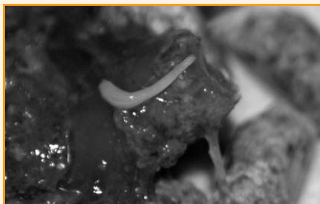
Die Katze kratzt sich vielleicht wegen Ohrmilben und auch der Kot verrät etwas über Parasiten

Sollten Sie ihr Haustier in den Urlaub in südlichere Gefilde mitnehmen, achten sie darauf, dass es auch gegen die dort heimischen Parasiten geschützt ist.