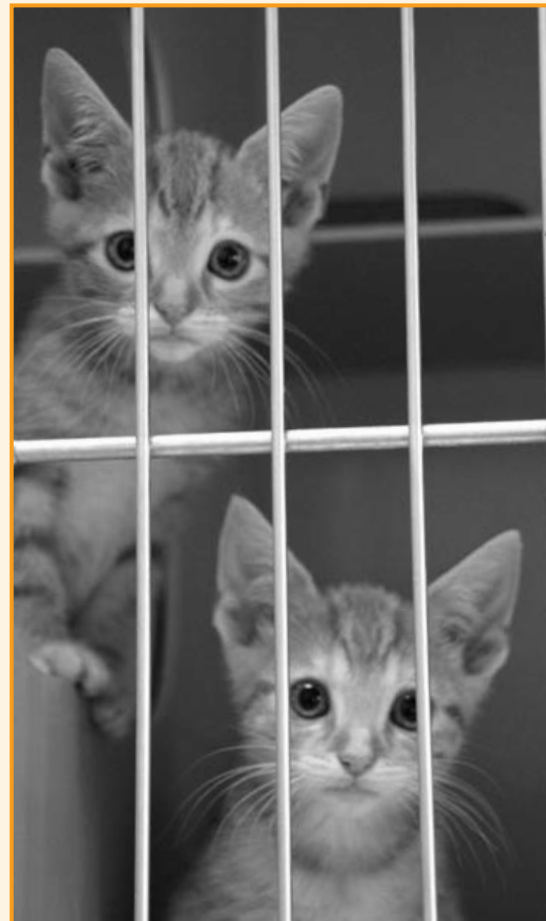
Samt Kennel in die Brennesseln geworfen

zwei Tage später wurde eine Spaziergängerin durch jämmerliche Laute aus einem mit Brennessel verwucherten Gelände aufmerksam. Sie ging diesen kläglichen Geräuschen nach und fischte einen Kennel aus den Brennesseln, kopfüber lag er da. Sie traute ihren Augen nicht – drei kleine Katzen – sollten im Kennel den Tod finden.